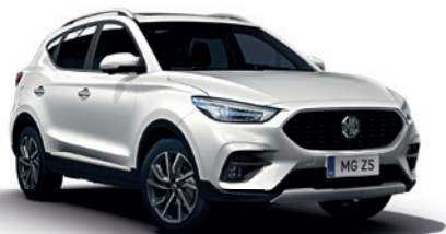
Biały „Arctic White” (standard)