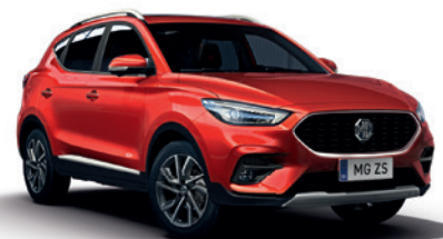
Czerwony „Dynamic Red” (trójwarstwowy)