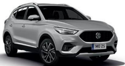
Srebrny „Monument Silver” (metalik)