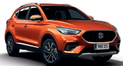
Pomarańczowy „Hoxton Orange” (metalik)