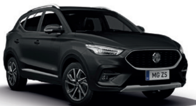
Czarny „Black Pearl” (metalik)