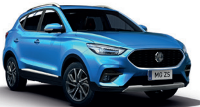
Niebieski „Battersea Blue” (metalik)