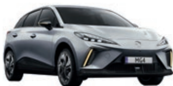
● Srebrny „Medal Silver” metalik