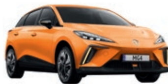
● Pomarańczowy „Fizzy Orange” trójwarstwowy