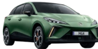
● Zielony „Hunter Green” matowy