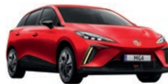
● Czerwony „Diamond Red” trójwarstwowy