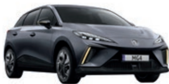
● Szary „Andes Grey” metalik