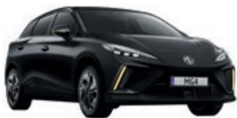
● Czarny „Pebble Black” metalik

Wybierz wariant wyposażenia: Standard, Comfort, Luxury, Luxury Long-Range, XPOWER, i przyciągaj spojrzenia, gdziekolwiek pojedziesz.