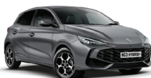
SZARY „HAMPESTEAD GREY”** (metalik)