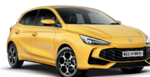
ŻÓŁTY „PASTEL YELLOW”** (standard)