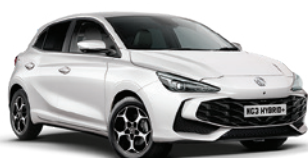
BIAŁY „DOVER WHITE” (standard)