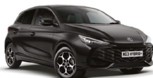
CZARNY PEBBLE BLACK* Lakier metaliczny