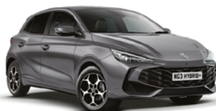
SZARY HAMPSTEAD* Lakier metaliczny