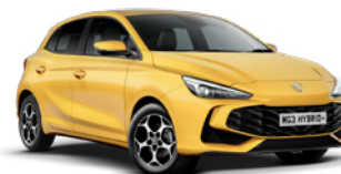
ŻÓŁTY PASTEL Lakier standardowy