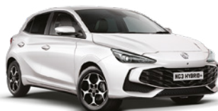
BIAŁY DOVER WHITE Lakier standardowy