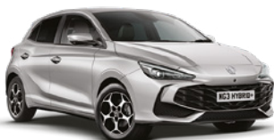
SREBRNY COSMIC* Lakier metaliczny