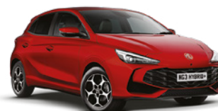
CZERWONY DIAMOND RED* Lakier trójwarstwowy