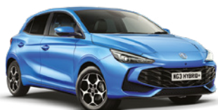
NIEBIESKI COMO* Lakier metaliczny

Przygotuj się na to, że będziesz przyciągać uwagę.